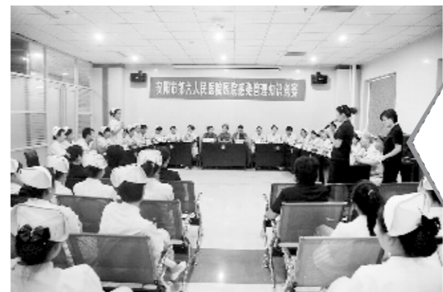
近日,安阳市第六人民医院举办了首届医院感染管理知识竞赛。竞赛内容涉及消毒隔离、职业防护、抗生素合理应用、多重耐药菌的防控措施、感染诊断、医疗废物的规范管理等,全院共有39支代表队参赛。图为比赛现场。