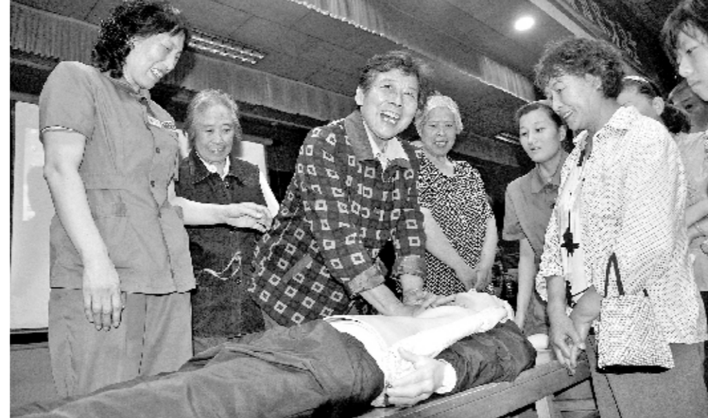
8月21日,开封市第一人民医院组织了一场别开生面的“家庭应急户外自救大讲堂”。急救专家们分别向现场200多名市民讲授了心跳骤停、中毒、触电、溺水等的预防救治常识和急救操作技巧。图为市民们在学习体外心脏按压技术。